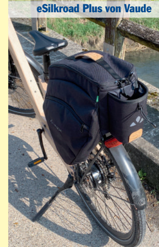
eSilkroad Plus von Vaude