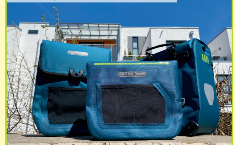
E-Mate (links, rechts) und E-Glow (Mitte) von Ortlieb