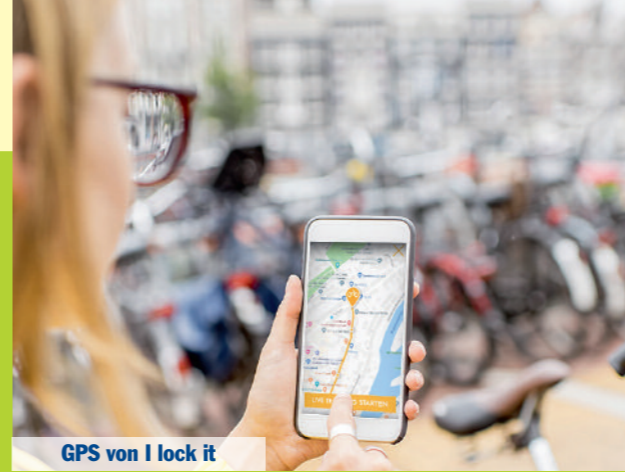
GPS von I lock it

Bewegungen in allen drei Dimensionen und löst dann einen Alarm aus. Sollte die Erschütterung nur kurz andauern, zum Beispiel ausgelöst durch einen Fußball, gibt das System lediglich einen kurzen Warnton ab. Abschreckfaktor garantiert. Ähnlich funktioniert das smarte Rahmenschloss I lock it GPS (199 Euro inklusive GPS Tracking für zwei Jahre, dann monatlich 2,90 Euro). Zusätzlich zum Alarm startet bei einem Diebstahlversuch der Live Tracking Modus. Der Besitzer bekommt über die dazugehörige App eine Benachrichtigung. Das Schloss überträgt die aktuelle Position des Fahrrads übers Mobilfunknetz ans Smartphone und der Besitzer kann diese in ganz Europa in Echtzeit verfolgen. Da die genaue Standortbestimmung zwischen 10 und 100 Metern variieren kann, soll die Nahortungsfunktion via Bluetooth und die Signaltonfunktion mit einem 110 dB lauten Signalton die Suche nach dem Diebesgut erleichtern. – jb/bg Internet: www.abus.com www.ilockit.bike