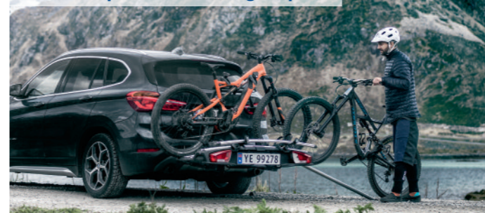
Thule Velospace XT 2 mit Loading Ramp XT

drei bis vier Räder (729,95 Euro) erhältlich ist. Da E-Bikes häufig etwas ausladender gebaut sind, lohnt sich die Investition schon bei zwei Rädern in das größere Modell. Praktisch bei wenig Stauraum in der Garage ist auch der faltbare Träger EasyFold XT von Thule (ab 739,95 Euro), der ebenfalls eine Zuladung von 60 Kilogramm zulässt und für zwei oder drei Räder zu haben ist. Gut geschützt vor Witterung und Co. sollte das teure Transportgut auch sein. Die deutsche Firma Fahrer Berlin bietet Schutzhüllen aus Neopren für sämtliche Bauteile an: Motor, Akku, Lenker, Pedale, Display. Diese sind dank Klettverschlüssen für viele verschiedene Pedelec-Modelle geeignet und lassen sich ganz fix anbringen. Sie bewahren so die empfindlichen Bestandteile vor Staub, Regen, Kratzern und anderen Einflüssen. Die Schutzhüllen sind einzeln, wie das Motor Cover Premium , verfügbar oder auch als Set in verschiedenen Ausführungen (ab 63,90 Euro) erhältlich. – jb Internet: www.thule.com www.fahrer-berlin.de