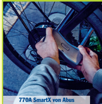
770A SmartX von Abus

Pedelecs sind kein günstiges Vergnügen – und deshalb auch heiß begehrt bei Langfingern. Um das oft mehrere tausend Euro teure Gefährt vor Dieben zu schützen, sollte man auch zu entsprechend sicheren und hochpreisigen Schutzmechanismen greifen. Und davon gibt es viele: vom Fahrradschloss, das laut Alarm schlägt, wenn sich jemand daran zu schaffen macht, bis zum fest im Rad verbauten GPS-System wie es beispielsweise für Maßanfertigungen der Holzpedelecs von My Esel (siehe Seite 9) ab Werk erhältlich ist. Auch ein Blick in die Versicherungsunterlagen lohnt sich, um gerüstet zu sein, falls das teure Rad doch einmal abhanden kommt (siehe A&R 5/2021, S. 11).