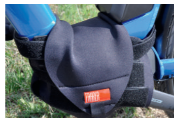
Motor Cover von Fahrer Berlin

Pedelec auf den Fahrradträger laden und mit dem Auto an einen anderen Ort fahren, um dort eine tolle Tour oder Urlaub zu machen – einfacher geht es nicht. Doch beim Transport von Pedelecs sollte man ein paar Dinge beachten: Die Räder mit elektrischer Unterstützung wiegen mehr als normale Velos – oft über 20 Kilogramm. Ausschlaggebend ist zum einen die zugelassene Stützlast auf der Anhängerkupplung, sollten die Räder dort auf einem Träger transportiert werden. Diese beträgt häufig nur 75 Kilogramm. Bei einem Eigengewicht des Trägers von etwa 20 Kilogramm dürfen alle Räder zusammen nicht mehr als 55 Kilogramm wiegen. Das klappt bei zwei E-Bikes meist noch ganz gut, bei dreien wird es eng. Eine Idee wäre, zusätzlich einen Dachträger einzusetzen. Doch die schweren Pedelecs lassen sich nur mit Mühe aufs Auto heben. Auch für den Träger auf der Anhängerkupplung empfiehlt sich eine Rampe, wie sie zum Beispiel Thule mit der Loading Ramp XT (55,50 Euro) anbietet. Noch ein Tipp für weniger Gewicht: Falls möglich, Akkus ausbauen und sicher verstaut im Auto mitnehmen. Für schwere Räder werden zudem geeignete Fahrradträger für die Anhängerkupplung angeboten, wie der Velospace XT von Thule , der für zwei bis drei (629,95 Euro) oder